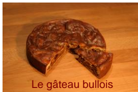
Le gâteau bullois