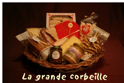
La grande corbeille

Les produits de notre terroir : Une idée cadeau !