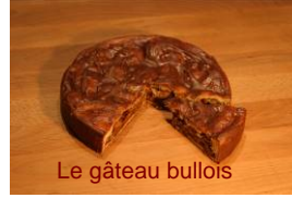
Le gâteau bullois