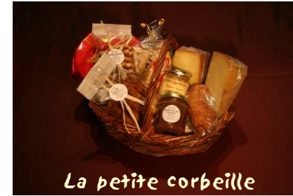
La petite corbeille