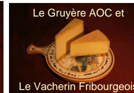
Le Gruyère AOC et