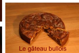
Le gâteau bullois