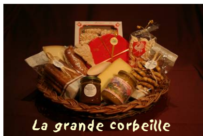
La grande corbeille

Les produits de notre terroir : Une idée cadeau !