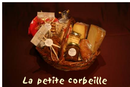
La petite corbeille