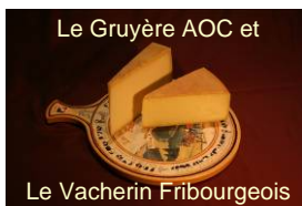
Le Gruyère AOC et