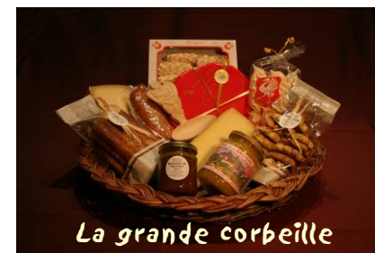
La grande corbeille

Les produits de notre terroir : Une idée cadeau !