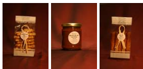
Pains d'anis, moutarde et bricelets

Nous vous proposons des corbeilles ou baquets contenant les produits de votre choix, parmi notre production et celle de nos partenaires artisans !