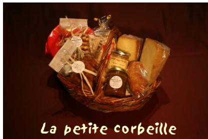
La petite corbeille