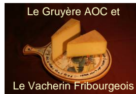
Le Gruyère AOC et